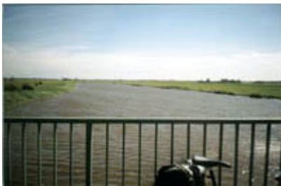
Über die Eider

Dort angekommen, konnten wir nicht mehr als eine Startbahn aus Asphalt und einen Tower ausmachen; keine Flugzeuge in der Luft, keine, die sonst irgendwo rumstanden. Kurz gesagt: Nix los. Dann jedoch ließ uns das laute Brummen eines Hubschraubers aufhören. In nur wenigen Metern Höhe brummte ein Militärhubschrauber über den Flugplatz hinweg und die Besatzung winkte uns zu. Nachdem der Hubschrauber verschwunden war, erlebten wir dann doch noch einiges, da einige Cessna und Ultraleichtflugzeuge landeten und starteten.