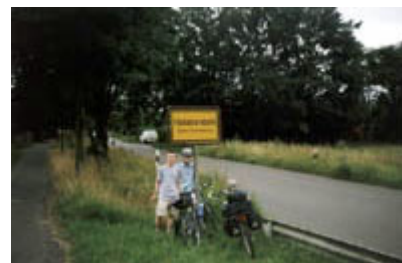
Wieder daheim in Halstenbek