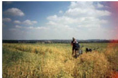
Pause in der Holsteinischen Schweiz

Eigentlich hatten wir vor an diesem Abend etwas früher zu Bett zu gehen, das wurde nur durch 4 Ladies verhindert, mit denen wir uns noch bis um 2 Uhr nachts unterhielten.