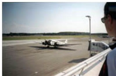
Flugplatz Lübeck-Blankensee mit der JU52