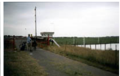
Warten am Sperrwerk an der Krückau