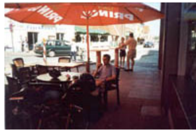
Fischbrötchen-Essen in Husum