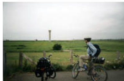
Auf dem Nordseeküstenradweg an der Elbe