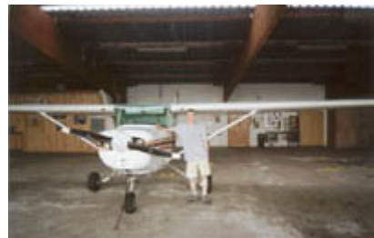
Die Cessna und ich