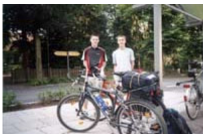
Jetzt gehts los!

Dort war gar nichts los. Trotzdem schnallten wir unser gesamtes Gepäck von den Rädern, schlossen diese zusammen und begaben uns ins Flughafen-Restaurant, in dem ich mir erst einmal einen Eisbecher gönnte. Als wir auf den Aussichtsturm stiegen, landete just in diesem Moment die JU 42. Mehr passierte allerdings auch nicht, sodass wir uns wieder in Richtung Lübeck und Jugendherberge aufmachten. Dort angekommen begaben wir uns in unser 6er Zimmer, duschten und fuhren noch einmal in die Innenstadt um Essen zu gehen.