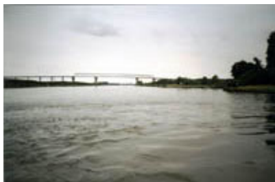
Über den Nord-Ostsee-Kanal