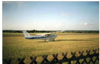
Eine Cessna 172 in St. Michaelisdonn