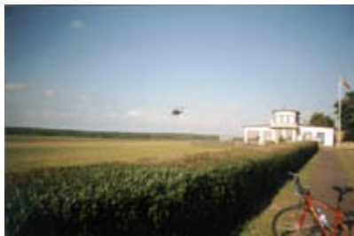
Hubschrauber überquert im Tiefflug Flugplatz St. Michaelisdonn