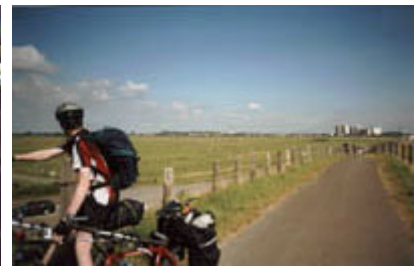
Blick vom Deich auf Husum