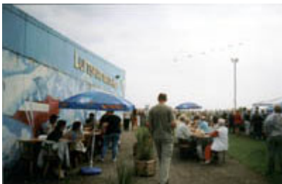
Flugshow in Kiel-Holtenau

In der Jugendherberge erhielten wir zum ersten mal ein Zweibettzimmer und sogar einen Zentralschlüssel fürs ganze Haus.