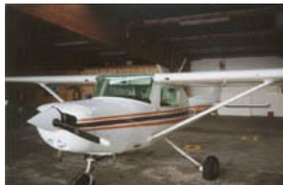
Eine ausgestellte Cessna 152