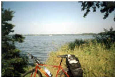
Das Selker-Noor bei Eckernförde

In der Pension wurden wir freundlich begrüßt und ich fiel nur noch aus dem Schuhen ins (übrigens sehr bequeme) Doppelbett und schlief zwei Stunden.